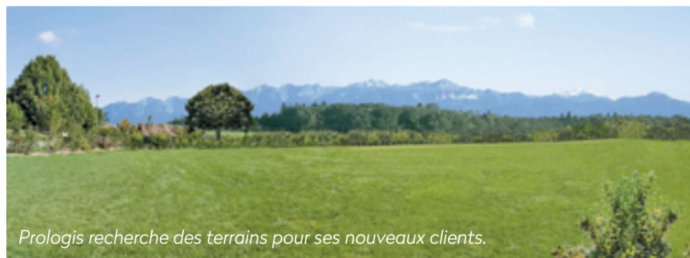
Prologis recherche des terrains pour ses nouveaux clients.

Les experts de Prologis se feront un plaisir de répondre à vos questions et de vous proposer un service clé en main.