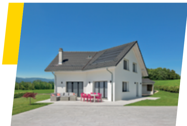
PME familiale fondée en 1997, Prologis construit près d'une centaine de maisons par an.

Cette perspective peut sembler complexe. Mais rassurez-vous : Prologis vous accompagne pas à pas dans tout projet de valorisation, qu'il s'agisse d'une simple